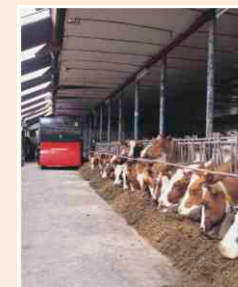
Via een brede doseerband kan het voer zowel naar links als naar rechts, snel en morsvrij gedoseerd worden.