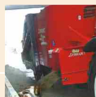
Perfect en homogeen gemengd voer. Voerstructuur blijft optimaal.