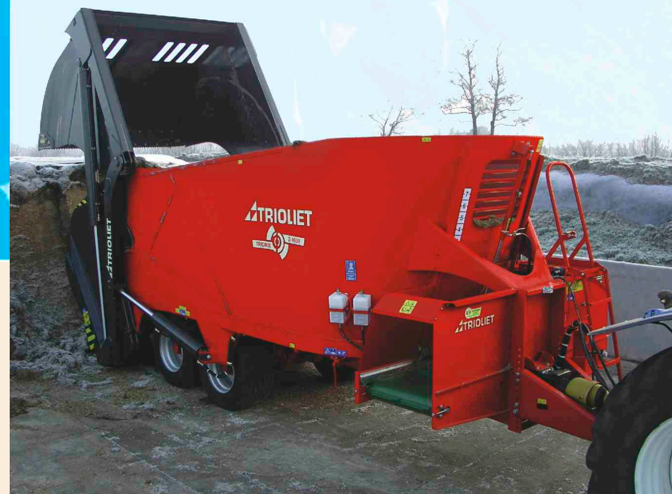
Type Triomix 2 is standaard uitgevoerd met pendelend tandemstel.

Een paar details verdienen nog even aparte aandacht. De bediening bijvoorbeeld. In de standaard uitvoering luxe en betrouwbaar, dankzij de elektrische bediening. Een belangrijke optie is de elektronische weeginstallatie. Simpel te hantelen en buitengewoon nauwkeurig in z'n werking. Verder staan er nog een aantal nuttige accessoires tot uw beschikking. We noemen hierbij een hydraulische steunpoot, hydraulisch contrames, snelheidsregeling van de dwarsafvoerband, afdichtborstel voor de laadklep, schakelbare reductiekast, verlichting, verstelbare dwarsafvoerbandverlenging, hydr. reminrichting en banden voor hogere snelheden.