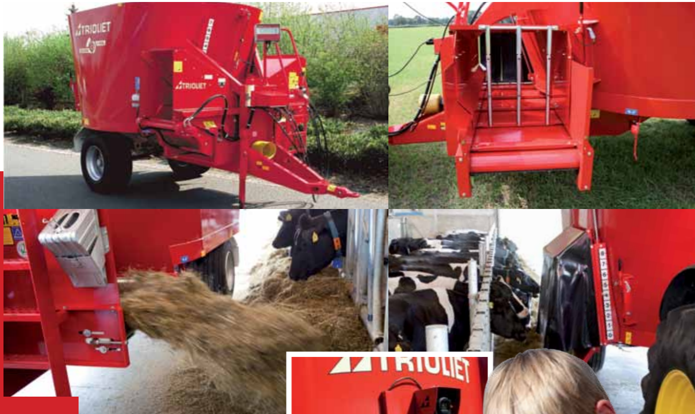
Camera achterop de voermengwagen →