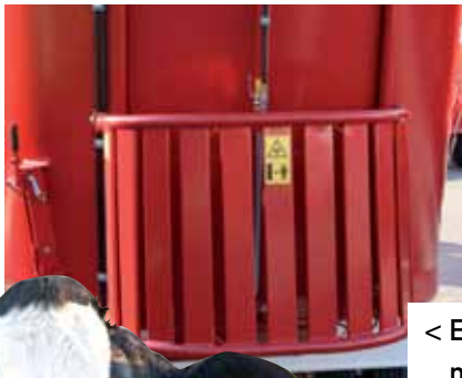
< Extra doseerschuiif middenachter