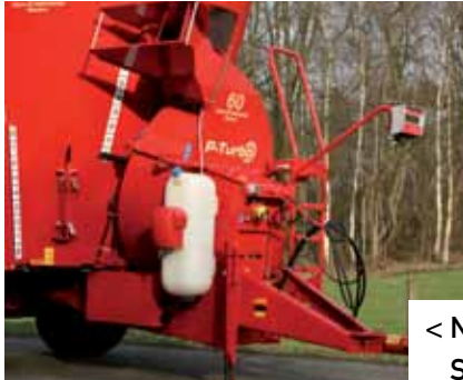
< Nevelinstallatie Solomix P