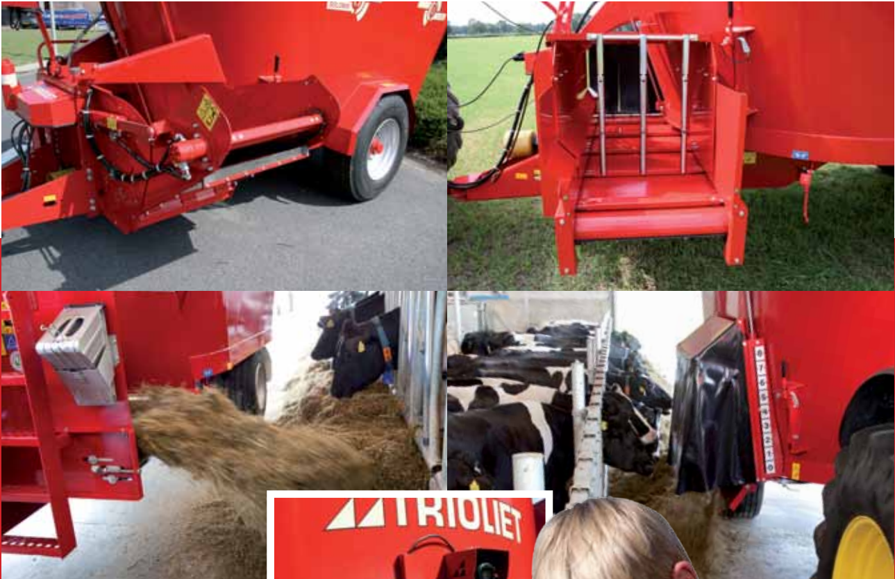
Camera achterop de voermengwagen →