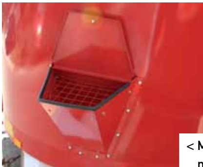
< Mineralentrichter met afsluitdeksel