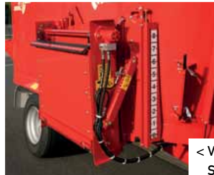
< Verstelbare opvoerketting Solomix ZK