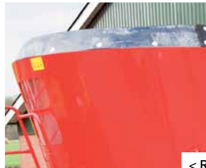
< Rubber Hooring