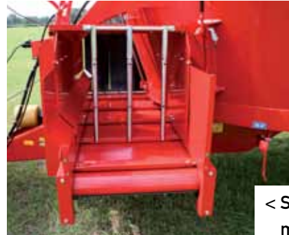
< Scharnierbare magneetset