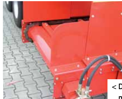
< Dwarsafvoerunit met zijschuifinrichting