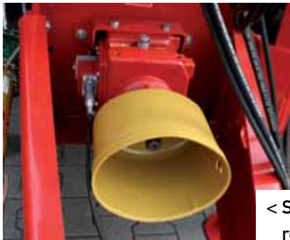
< Schakelbare reductiekast