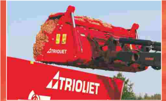
5 gebogen tanden voor het probleemloos uitnemen van gras of maïs.