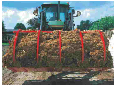
Door de optimale gebogen tandvorm is weinig kracht nodig voor het sluiten van de bovenvork.

De machine is eenvoudig, degelijk en daarvoor nagenoeg onderhoudsvrij. Kortom een machine die jarenlang meegaat.