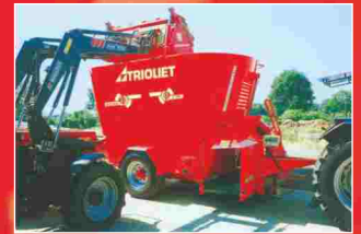
Verliesvrij transporteren. Effectief en eenvoudig laden.

De kuilgrijper Silogrip wordt standaard geleverd met een hydraulische vork met sikkelvormige tanden, aan weerszijden van de schepbak twee vorktanden, mangaanstalen slijtstrippen onder de schepbak, twee hydraulische knijpcilinders met kogelscharnieren, euronorm snelkoppelsysteem