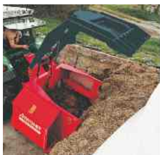
Ook de Masterkam heeft een grote laadcapaciteit door een slank en robuust geconstrueerd krabbord met spitse vertanding.