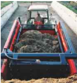
De UKW 5000 kan optimaal gevuld worden.

Het snijbord heeft twee lange zijmessen, waardoor een relatief dikke plak kuilvoer snel, efficiënt en met geringe weerstand tot op de laadklep schoon kan worden uitgesneden.