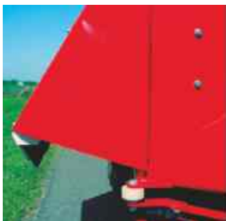
De Silobuster/Silokam is standaard voorzien van volledig afgesloten doseerklep(pen) en stootrollen.