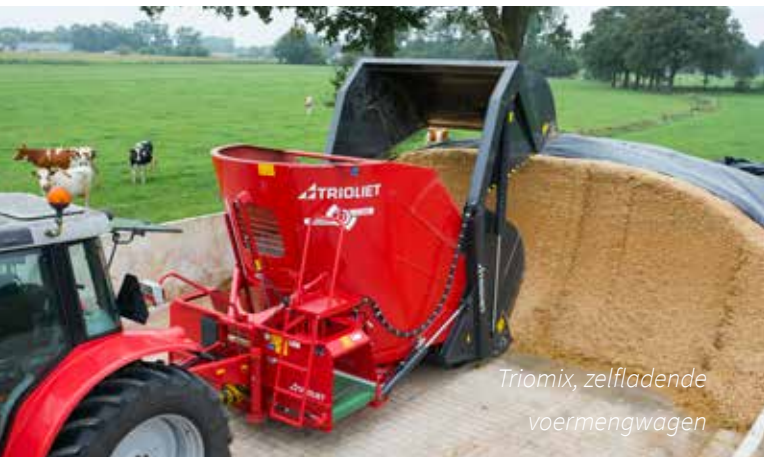
Triomix, zelfladende voermengwagen