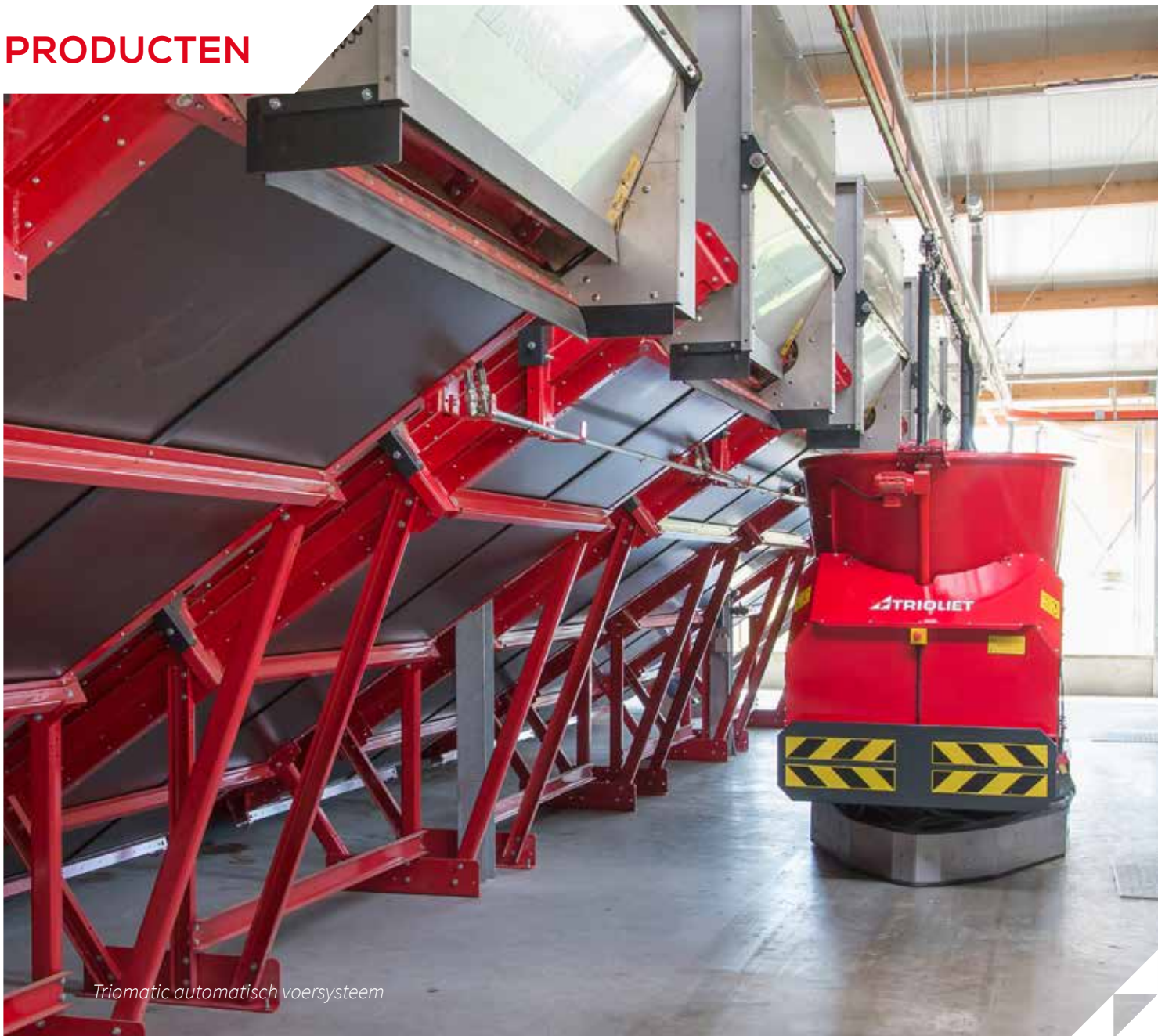
Triomatic automatisch voersysteem